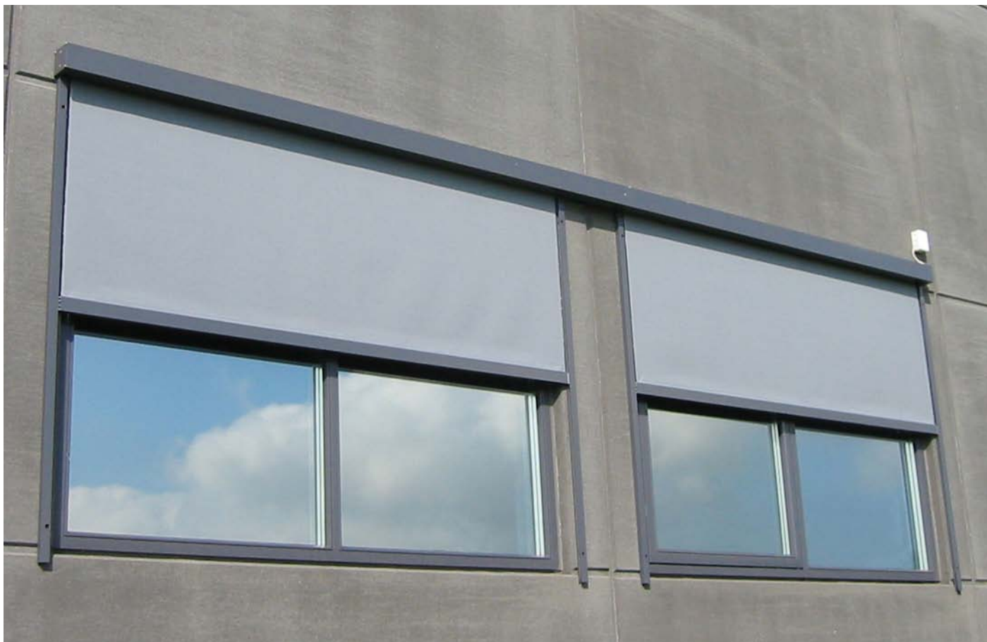
To screens, JM-F85, der er koblet sammen og monteret direkte på facaden